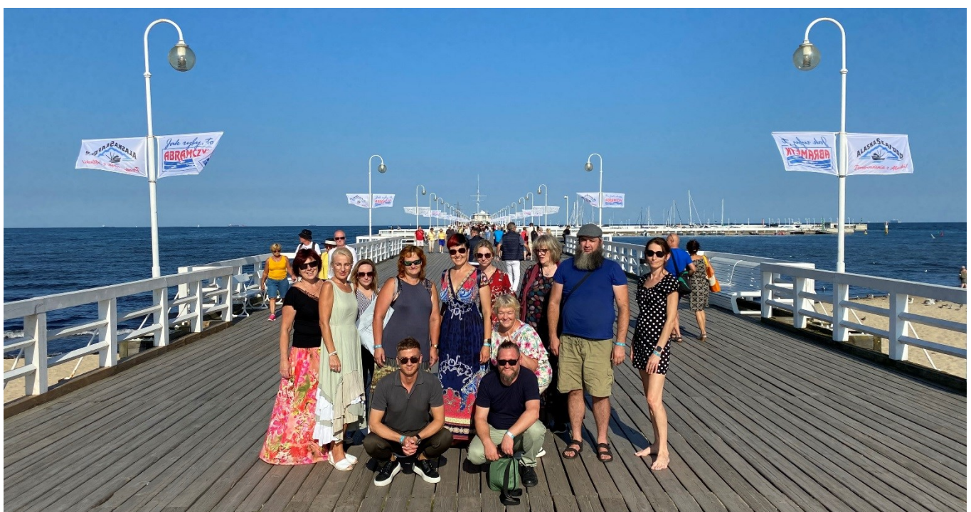
Kolleegid Sopotis muulil

Leian, et see reis aitas igati kaasa osalejate kollegiaalsete suhete paranemisele/tugevnemisele. Ühised kogemused liidavad ja tekitavad üksteise osas usaldust. Läbi taoliste töölahetuste, kus tööalane on põimitud kultuurilise silmaringi avardamisega, loomegi ühtse tugeva kollektiivi!