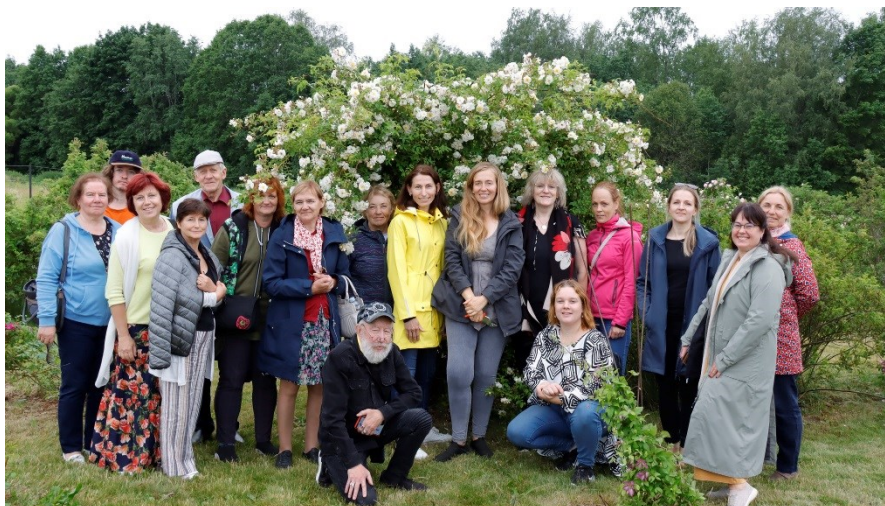
Aianduskooli roosihuvilised Roosoja roosariumis

dersellitamist. Ilm ka muudkui paranes, mis soosis meie retke igati. Siirdusime Mahtra talurahvamuuseumi Atla mõisa aladel. Tutvusime väljapanekutega ja muu hulgas andis giid meile väga hari-va ülevaate piirkonna ajaloost. Matkasime looduspaikades, leidsime karste ja hiidrahne. Kõige vapram meist isegi vallutas Eestimaa Kivide Kuninga!