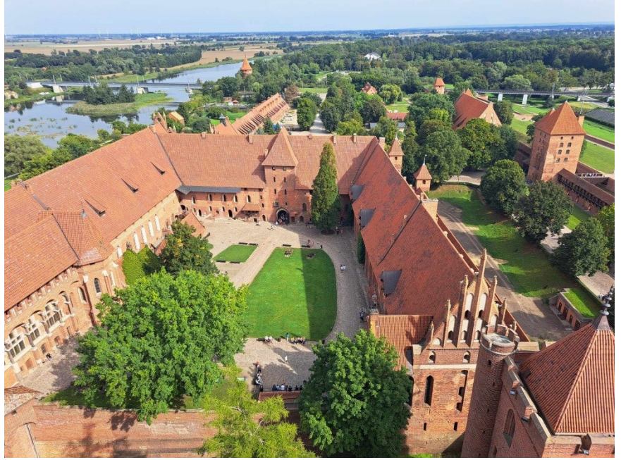
Vaade Malbroki kindluse tornist

Gdansk, võrratu linn, parajalt suur, imeline arhitektuur. Uskumatu, et selline pärl asub meile nii lähedal. Võrdlus,