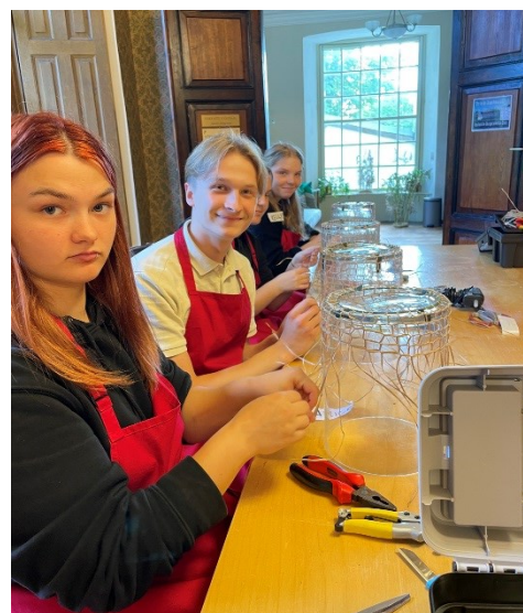
Workshopi päeva meisterdamised