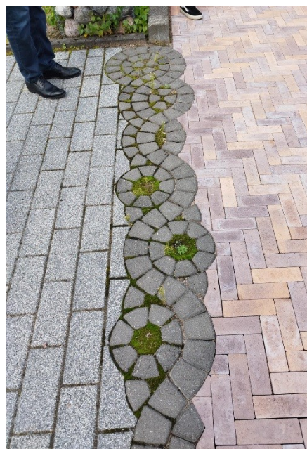
Erinevaid võimalusi sillutise paigaldamiseks