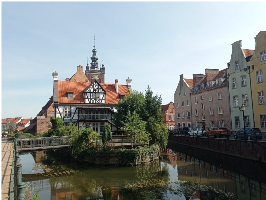
Pilkupüüdev majake kiriku taustal – Gdanskis

Gdansk – ilusa kultuuriga linn, maitsev toit ja hea melu.