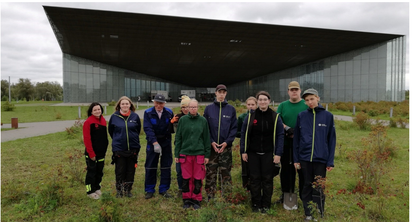
Aianduskooli õpilased tulevasele tulbiväljal