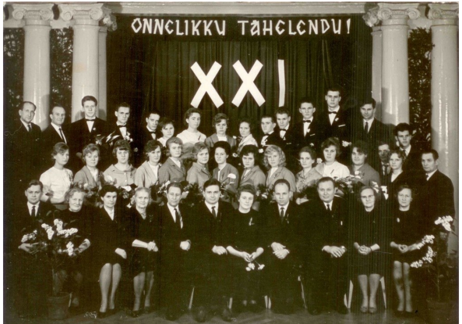
V-b kursus (23 aiandusagronoomi) koos õpetajatega lõpuaktusel (23.1.1965)