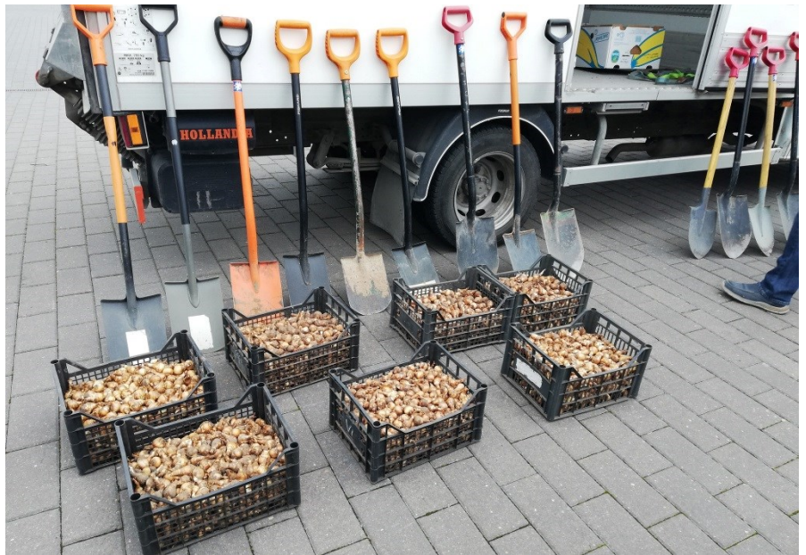
Tuhanded tulbisibulad ootavad istutamist

Nartsissid, mida istutasime, kandsid ladinakeelset nimetust Narcissus 'Ice