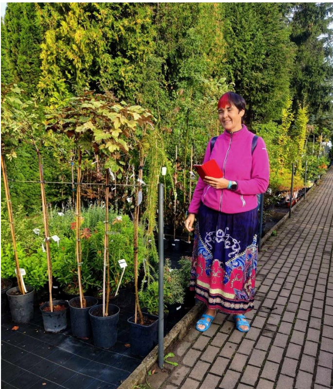
Epp aianduskeskuses uudistamas

Kõige teravam elamus Gdanskis oli võistluste lõpetamine ja maastikuehitajatele kaasa elamine. Malborki kindlus oli võimas objekt, mida külastaks veel ja võtaks rohkem aega seal ringi liikumiseks.