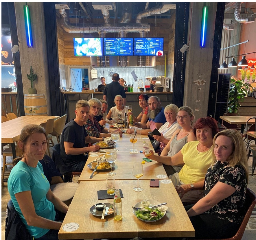
Toidunautlejad Monttownia Food Hallis